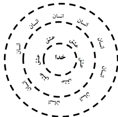
شکل ۱: رابطه انسان با عشق و خدا

صفت عشق برجسته‌ترین صفت انسان در دیوان حافظ است. عشق واسطهٔ انسان و خدا است. انسان با نوشیدن شراب عشق به مستی حضور نایل می‌آید و این ارتباط دوطرفه وجود دارد. رسیدن به این مقام، هدف نهایی تربیت عرفانی است که عرفا نمونهٔ تحقق یافتهٔ آن را انسان کامل می‌نامند. (۴) رسیدن به عاشقی در انسان و فناء فی الله و بقاء بالله، بدون راهنما، برنامه و سند معتبر ممکن نیست «ظلمات است بترس از خطر گمراهی» (۴۸۸). تا معرفتی حاصل نشود، گرایش به عشق میسر نیست و معشوق ناشناخته می‌ماند؛ آن گونه که حافظ به این موضوع بارها اشاره می‌کند «طی این مرحله بی‌همراهی خضر مکن» (۴۸۸) و «بندهٔ پیر مغانم که ز جهلم برهاند» (۱۵۸). از این رو حافظ زیربنای عرفان خود را آموزه‌های وحیانی و تعالیم دینی قرار می‌دهد و مسیر رسیدن به انسان عاشق را با تکیه بر آن ترسیم می‌کند. (ادامه مقاله استنباط و شرح این موضوع است).