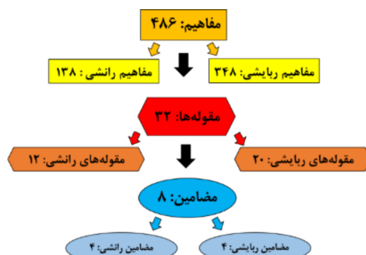
شکل ۱. مراحل طبقه‌بندی یافته‌های پژوهش؛ مربوط به سؤال ۱

باتوجه به هدف پژوهش و جهت دستیابی به نگرش و کشف لایه‌های ذهنی مخاطبان زیست‌نامه شهدا، با انجام مصاحبه با طیف وسیعی از مخاطبان جوان و دانشجو، فهرستی مشتمل بر ۴۸۶ مفهوم، ۳۲ مقوله و هشت مضمون استخراج و طبقه‌بندی گردید که در جداول شماره دو و سه ارائه گردیده است.