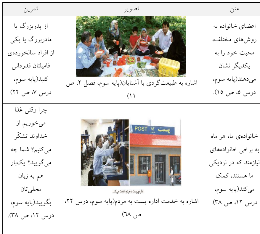
جدول ۶: نمونه‌هایی از مؤلفه‌های سرمایه اجتماعی در کتب مطالعات اجتماعی دوره ابتدایی

در جدول زیر برخی از متن‌ها، تصاویر و تمرین‌های موجود در کتب مطالعات اجتماعی که در راستای آموزش مؤلفه‌های سرمایه اجتماعی بودند درج شده است.