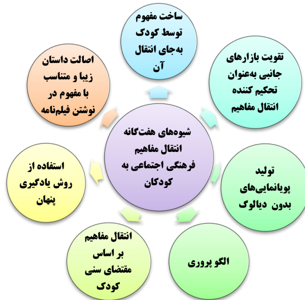
شکل ۳: شیوه‌های هفت‌گانه انتقال مفاهیم فرهنگی اجتماعی به کودکان