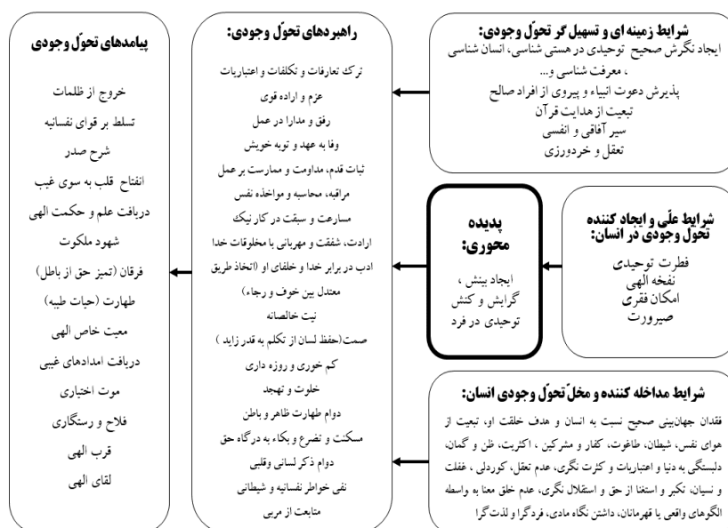
شکل ۱: الگوی تحول وجودی انسان با تکیه بر اندیشه عرفانی علامه طهرانی.

در طرحواره زیر الگوی تحول وجودی انسان با بررسی آثار علامه طهرانی ترسیم شده است: