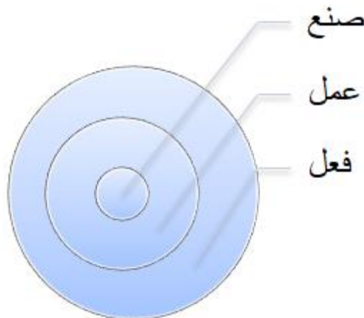
نمودار ۷. سطوح پیچیدگی ساختار رفتار

عموم و خصوص مطلق یا از ساده به پیچیده وجود داشته باشد، بدینگونه که واژه "عمل" نسبت "فعل" علاوه بر ویژگی فعل، همراه با اراده و تفکر بوده و صنع نیز، علاوه بر ویژگی های عمل، از پیوستگی، انسجام و ساختارمندی چیزی خبر میدهد. نمودار شماره ۷ این ارتباط این مفاهیم بصورت اندراجی سطح بندی کرده است.