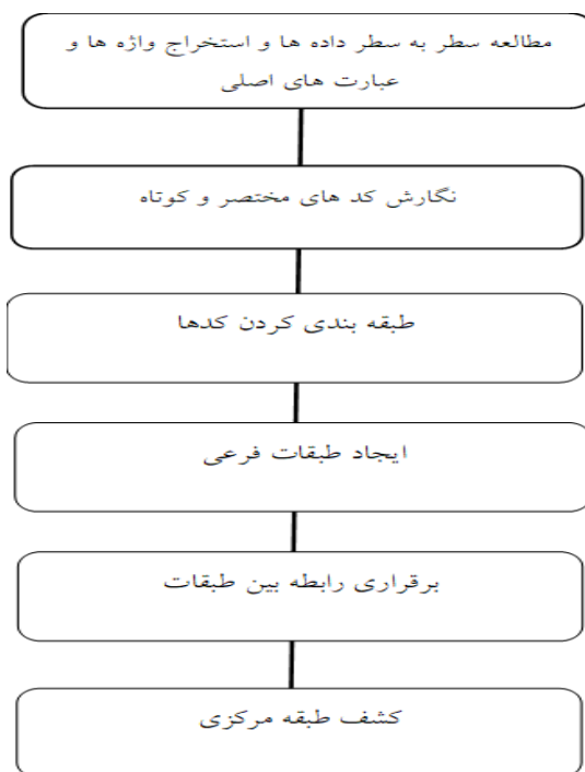
شکل ۱. مدل مفهومی روش تحقیق

در پژوهش حاضر مقاتل مورد بررسی قرار گرفت و از بین آنها پژوهش روی ۵ مقتل اصلی که بر اساس قدمت تاریخی و معتبر بودن اسناد آن کار پژوهش صورت گرفت که عبارتند از: مقتل ابی مخنف، نفس المهموم، مقتل ابن مقرم، مقتل شیخ مفید، مقتل لهوف.. همچنین در این پژوهش برای گردآوری داده‌ها از روش سند کاوی استفاده شده است. بر این اساس، کلیه‌ی کتاب‌ها، مدارک، اسناد، پایگاه‌ها، مقاله‌ها و پژوهش‌های در دسترس پژوهشگر که به بررسی این مفاهیم پرداخته‌اند، مورد مطالعه قرار گرفته و از آن‌ها فیش برداری شده است. ابتدا مقاتل قدیمی و نسخ اصلی و همچنین کتب و مقالات کلیدی در زمینه موضوع شناسایی و به صورت داده در نظر گرفته شد. سپس با مطالعه این متون، مؤلفه‌ها و عناصر تربیتی امام حسین علیه‌السلام در واقعه عاشورا استنتاج گردید نحوه استخراج الگوی تربیتی از خطبه‌های حضرت امام حسین علیه‌السلام را شرح داده است: