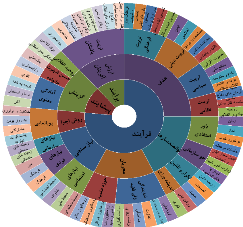
شکل ۱: مدل نهایی پژوهش

در نهایت پس از احصای اقدامات و سیاستهای متناسب با مؤلفه های استخراج شده، در راستای تحقق تربیت عقیدتی سیاسی نیروهای مسلح تمدن ساز، الگوی ذیل ترسیم شد.