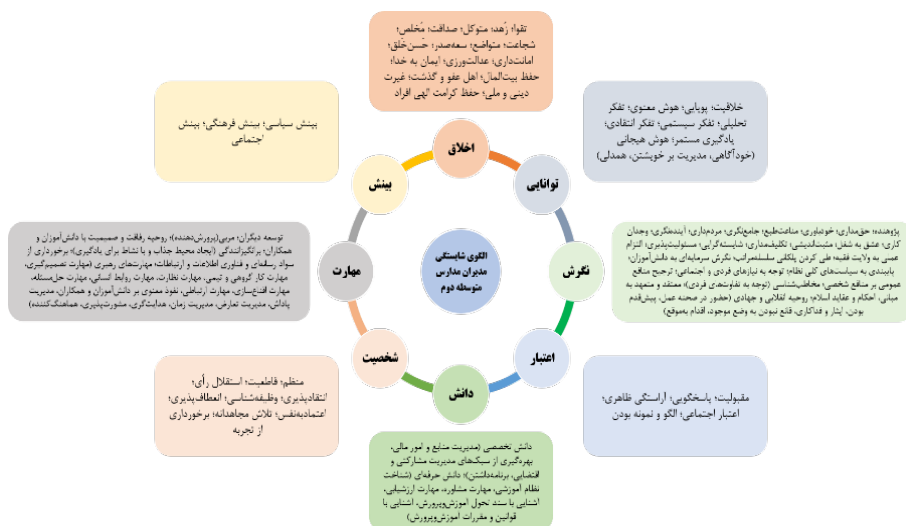
شکل ۲. مدل شایستگی مدیران دوره دوم آموزش متوسطه

در یک مدل نهایی، ابعاد و مؤلفه‌های پژوهش در قالب شکل زیر ارائه شده است.